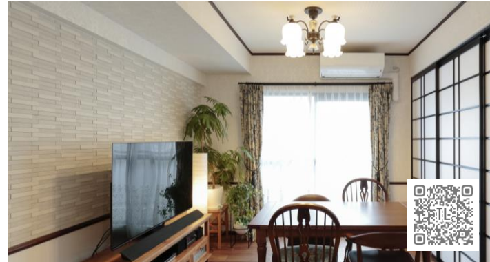
クラシックな雰囲気のリビングにもぴったり。