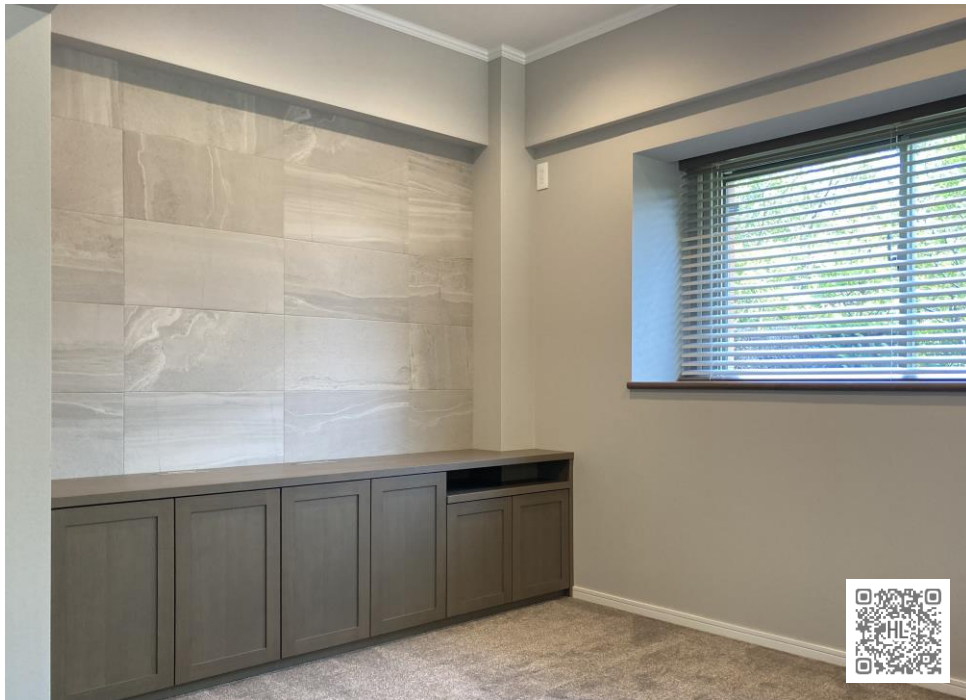
【after】一面エコカラット貼&グレーの壁紙でリユクスな雰囲気。オーダーのリビングボードもグレー系で色を統一しました。