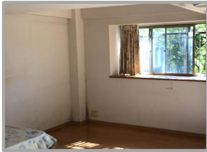
【before】普通の白い壁紙だったところに・・・

リフォームで内装をリニューアルする際、壁の一部に【エコカラット】を貼ってみませんか？